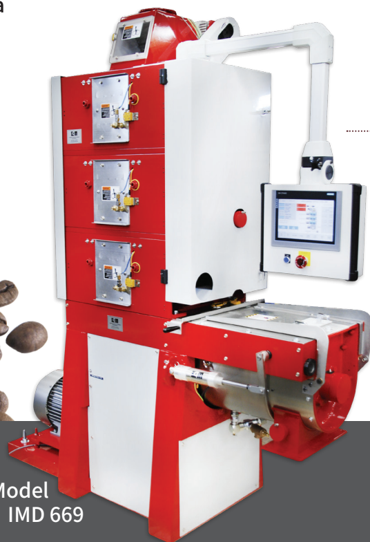
Model IMD 669