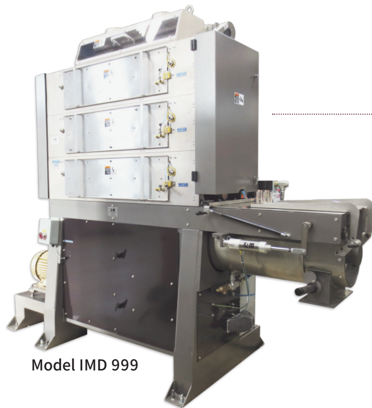
Model IMD 999