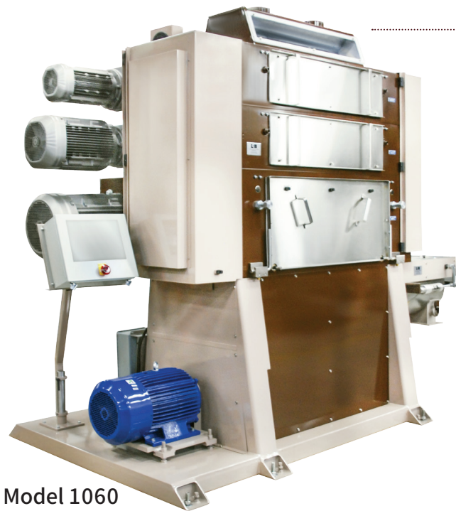
Model 1060 Supernova

公司成立於1957年，全球總部位於美國芝加哥，Modern Process Equipment Corporation (MPE) 是咖啡研磨器械設計與製造，與其它相關的加工設備不容置疑的領導者。這些能力結合MPE廣為人知的產品質量及服務提供您，我們的客戶，最優越、最符合您需求的方案。