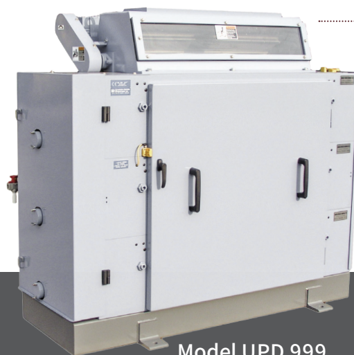
Model UPD 999